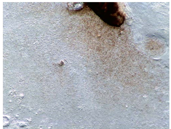
Retinal pigment epithelium cells in vitro.

Ayant été couronnée de succès dans des modèles animaux, la →