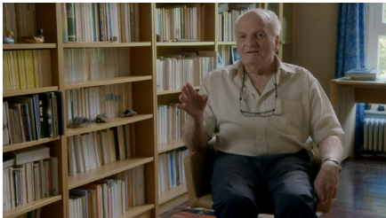
figure de Trolliet qu'ils ont bien connu, mais aussi son œuvre poétique, qui ne compte pas moins d'une trentaine de recueils.